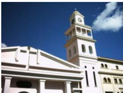
Catedral de Los Teques

Los Teques es el nombre de una parcialidad indígena Caribe que denominó la región montañosa que se conoce hoy con el nombre de Los Altos, en el Estado Miranda. Su jefe fue el indómito guerrero Guaicaipuro , indígena que acaudilló la resistencia a la penetración española en la región centro-norte de Venezuela. La voz 'teque' parece ser onomatopéyica (teque-teque). Puede tener su origen en una forma de comunicación de los aborígenes de la zona o bien provenir del sonido que emitían al caminar los collares y colgantes que usaban los indígenas como adorno personal.